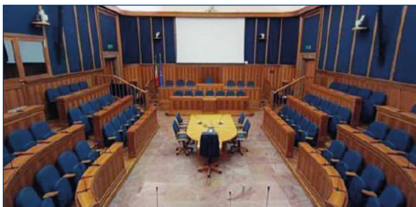
Fig. 9 Il “senatino” del Ministero dei LLPP

Come degna chiusura Telese ha chiamato, uno ad uno, i sei rappresentanti delle storiche categorie di