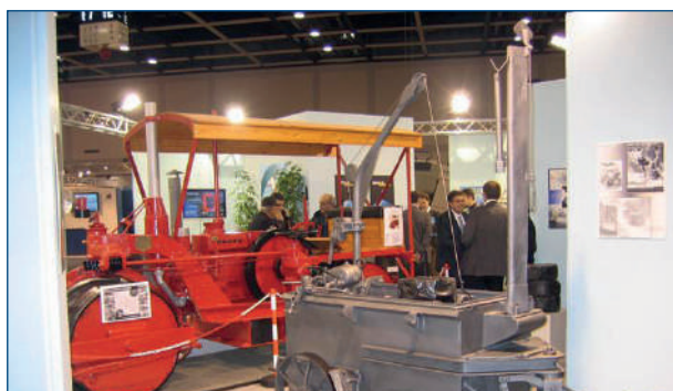
Fig. 5 Un rullo storico e un antico fusore del bitume.