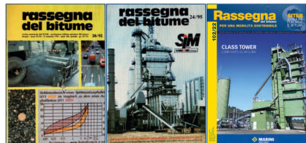
Fig. 10 Tre copertine della Rassegna, rispettivamente: 1992 (vecchia gestione); 1995 (nuova gestione) e 2022 (nuova denominazione SITEB)