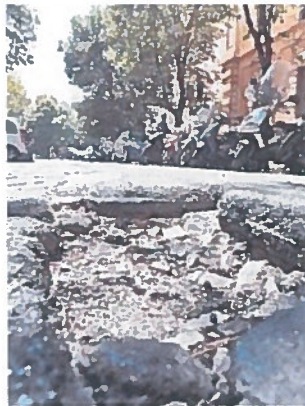
Le strade italiane sono sempre più dissestate , ma gli investimenti calano. Sopra un disegno di Roberto Micheli

«Gli stessi lavori annunciati dall'Anas (25.000 km gestiti) nel piano triennale - ha aggiunto Turrini - sono effettivamente partiti a "macchia di leopardo" in alcune Regioni senza impatti di rilievo e lo sblocco parziale del patto di stabilità che ingessava i Comuni non sembra aver avuto grande effetto sui consumi di bitume, nonostante il prezzo relativamente basso del petrolio che avrebbe dovuto incentivarne l'utilizzo». Pertanto si avverte il bisogno che «dal Governo centrale prenda avvio una seria campagna di manutenzione delle strade prima che il degrado ne comprometta definitivamente l'enorme valore complessivo, e stimato in 5.000 miliardi di euro, e renda troppo oneroso e non più sostenibile economicamente il suo ripristino». (ch.ben.)